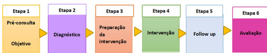
Fig.1: Modelo para o Plano de Inovação em PME's – Adaptado de Sousa et al (2010; 2014; 2015)

A parceria adaptou o modelo desenvolvido e validado (Fig.1) pela Associação Portuguesa de Criatividade e Inovação /Apgico, para o desenho de um Plano de Inovação Organizacional.