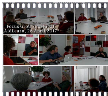
RefugeesIN Grupo Focal – Portugal, AidLearn

A reunião final do grupo focal português realizou-se no dia 28 de Abril de 2017 na sede do AidLearn em Lisboa, que selecionou duas longas-metragens para serem incluídas no Catálogo RefugeesIN. FATIMA , 2016 de Philippe Faucon e DHEEPAN , 2015 de Jacques Audiard.