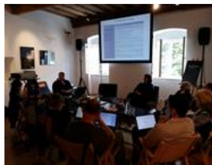
2ª Reunião do Projeto SILVER CODE, Ljubljana, Eslovénia

Se estiver interessada/o em participar na formação Silver-Code, não se esqueça de nos fornecer os seus dados de contacto no final do questionário. Consulte toda a informação no website do projeto e siga-nos no Facebook !