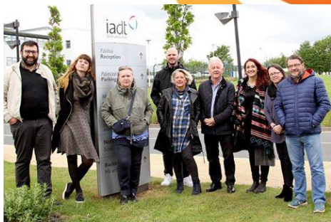
2ª Reunião do Projeto RefugeesIN, Dublin, Irlanda

Decorreu a 18 e 19 de Maio a segunda reunião do projeto RefugeesIN. A parceria acordou a conclusão dos dois primeiros produtos e discutiu as próximas etapas, incluindo a conceção do Curso RefugeesIN. Foi também o momento para um orador convidado analisar a situação dos refugiados na Irlanda.