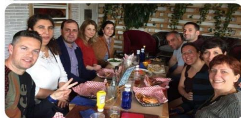
4ª Reunião do Projeto CREATUSE, Madrid, Espanha